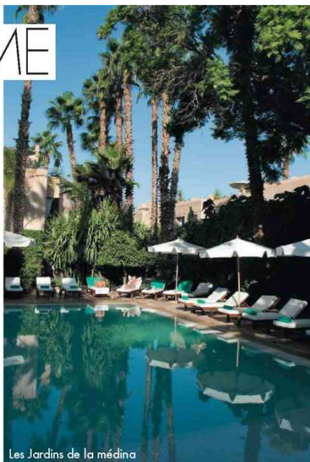
Les Jardins de la médina

On y va : à partir de 1 460 € par personne au départ de Paris, avec la TAP, via Salvador de Bahia. Inclus : nuits en pousada + transferts + petits déjeuners + guide bilingue. Tél. : 01 44 32 12 81. terre-bresil.com