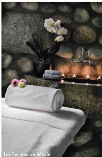
Les Fermes de Marie