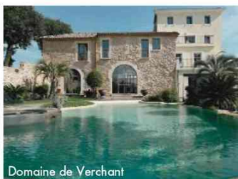
Domaine de Verchant

On y va : 265 € par personne, du 28 février au 2 mars, tapis de yoga Lolë en cadeau + à partir de 175 € la nuit en chambre double, en hôtel 2 étoiles. Possibilité d'autres packages. Tél. : 04 79 06 21 23. yoga-festival-valdisere.com